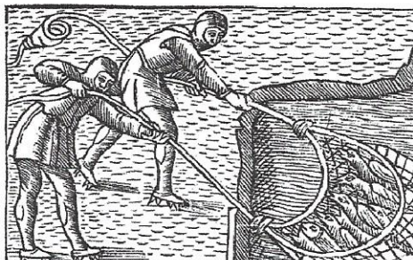
Fangstmetoden fra isen o. 1550 (Olaus Magnus, Historia de gentibus ..1555)

Fischfang von einer Eiskante aus, wie Olaus Magnus ihn auf einem Holz-schnitt 1555 dargestellt hat. So fischte man vermutlich auch von den Fischerbooten jener Zeit aus.